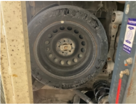
25. Reservehjul / dekkreparasjonssett