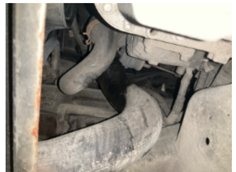
30. Utvendig tilstand motor