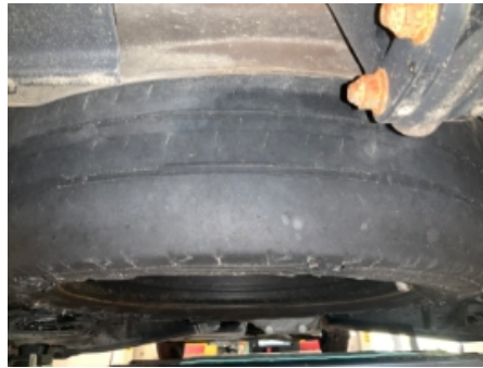
26. Reservehjul / dekkreparasjonssett