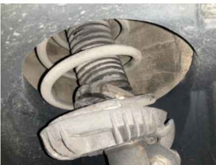
31. Fjærer / fjærbein