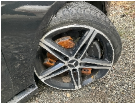
1. Opphengs- / bærearmer foraksel