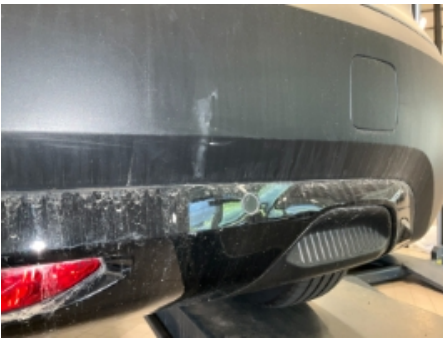
28. Lakk / karosseri utvendig