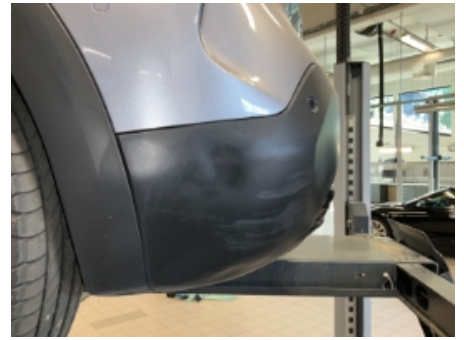
27. Lakk / karosseri utvendig