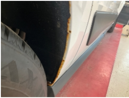
25. Karosseri generelt