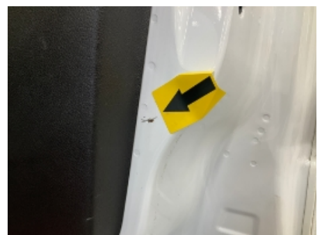
24. Karosseri generelt