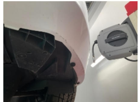
30. Karosseri generelt