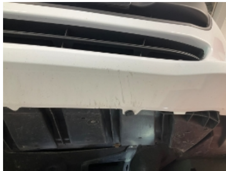
29. Karosseri generelt