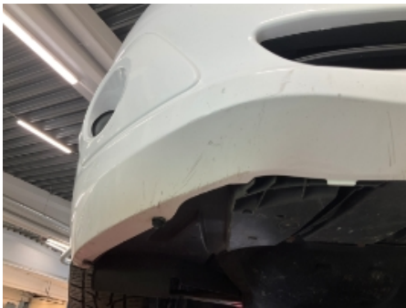
28. Karosseri generelt