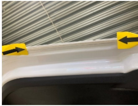
26. Karosseri generelt