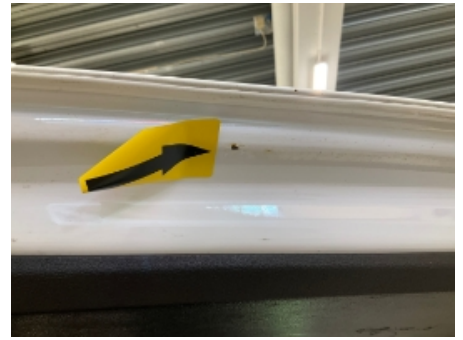
27. Karosseri generelt