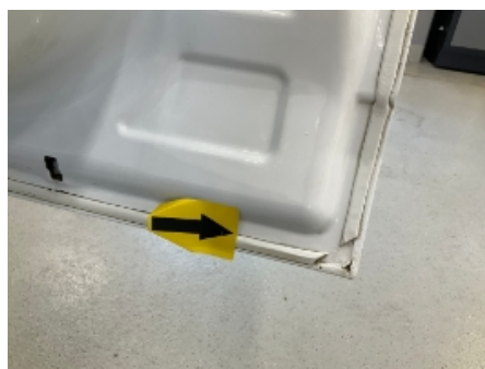
23. Karosseri generelt