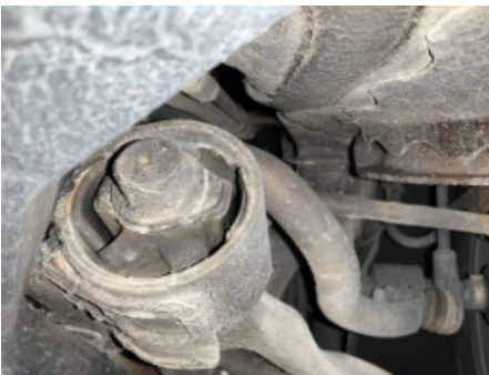
55. Oppvarmet bakrute