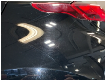
32. Lakk / karosseri utvendig