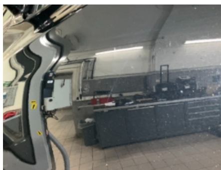
35. Lakk / karosseri utvendig