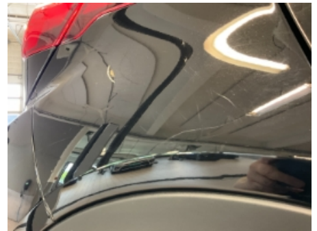
42. Lakk / karosseri utvendig