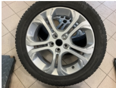
65. Ekstra hjulsett