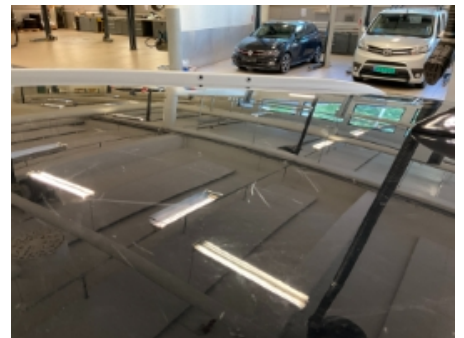
57. Lakk / karosseri utvendig