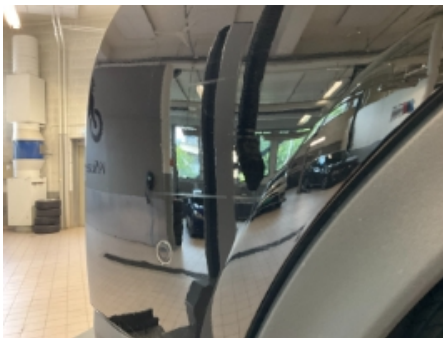
43. Lakk / karosseri utvendig