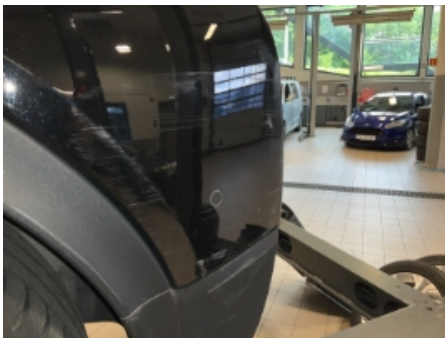
31. Lakk / karosseri utvendig