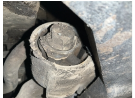
54. Opphengs- / bærearmer foraksel