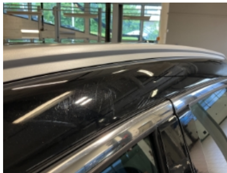
56. Lakk / karosseri utvendig