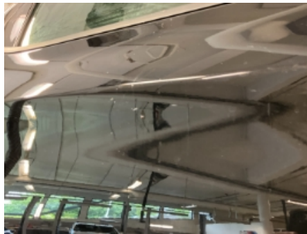
41. Lakk / karosseri utvendig