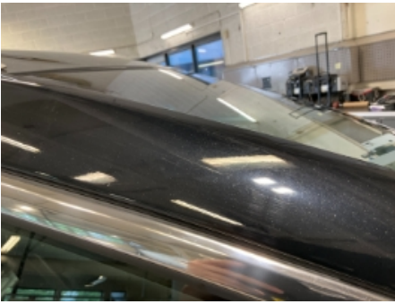
61. Lakk / karosseri utvendig