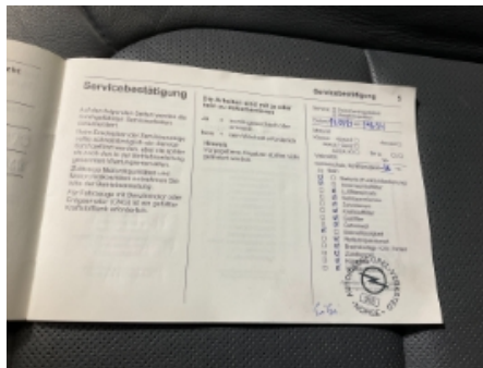
20. Service/ Dokum.