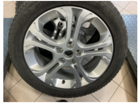
63. Ekstra hjulsett