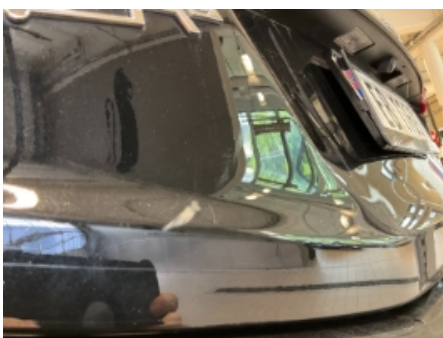
46. Lakk / karosseri utvendig