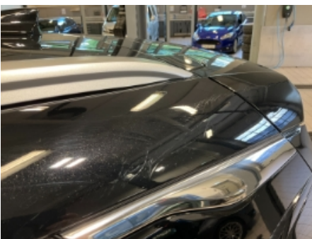
58. Lakk / karosseri utvendig