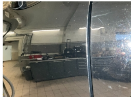
33. Lakk / karosseri utvendig