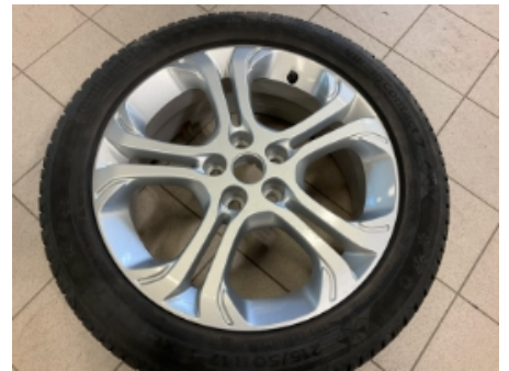
66. Ekstra hjulsett