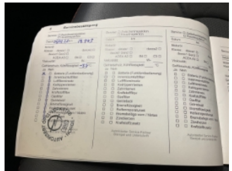
21. Service/ Dokum.