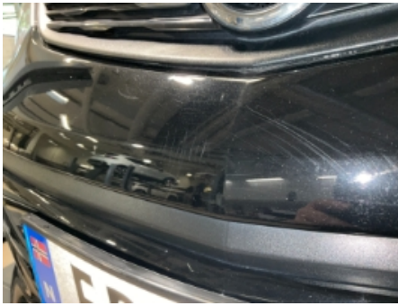
37. Lakk / karosseri utvendig