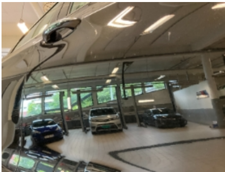
40. Lakk / karosseri utvendig