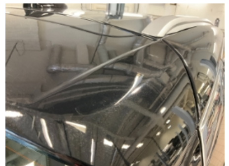
60. Lakk / karosseri utvendig