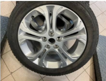
64. Ekstra hjulsett