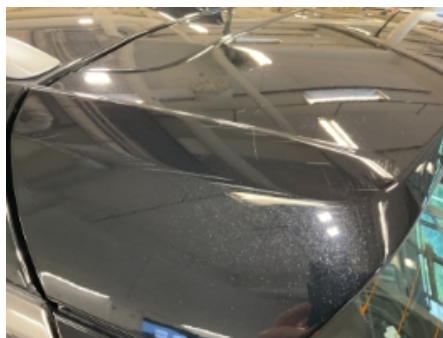
59. Lakk / karosseri utvendig