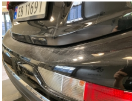
44. Lakk / karosseri utvendig