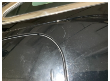
36. Lakk / karosseri utvendig