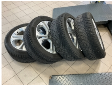
62. Ekstra hjulsett