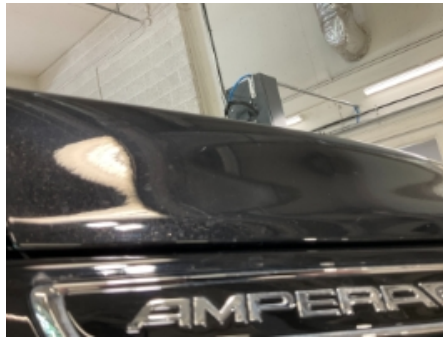
38. Lakk / karosseri utvendig