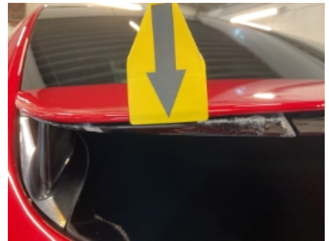
18. Lakk / karosseri utvendig