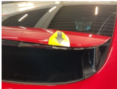
17. Lakk / karosseri utvendig