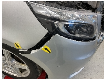
17. Lakk / karosseri utvendig