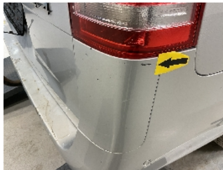
20. Lakk / karosseri utvendig