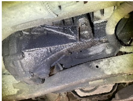
41. Utvendig tilstand motor