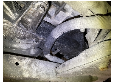
42. Utvendig tilstand motor