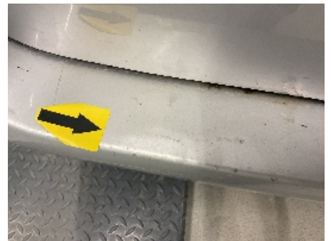
21. Lakk / karosseri utvendig