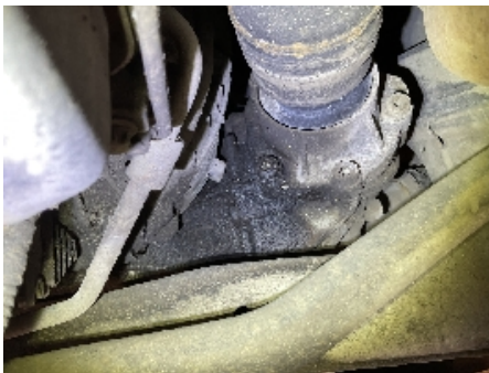
43. Utvendig tilstand motor