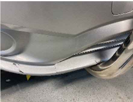
16. Lakk / karosseri utvendig