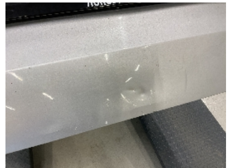
33. Lakk / karosseri utvendig