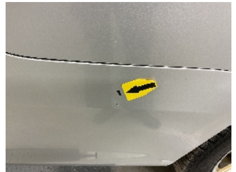
18. Lakk / karosseri utvendig