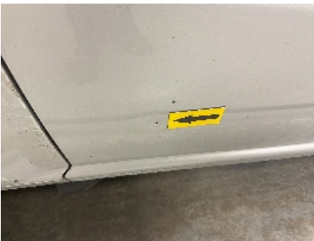
19. Lakk / karosseri utvendig