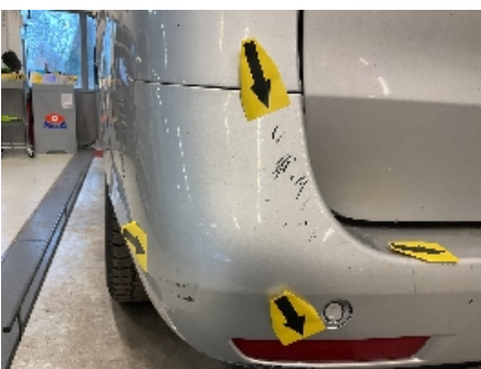
22. Lakk / karosseri utvendig