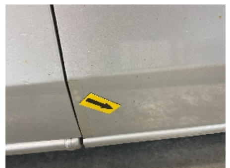
24. Lakk / karosseri utvendig