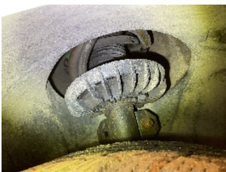
46. Fjærer / fjærbein