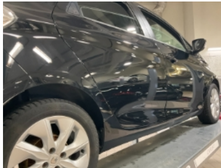
20. Lakk / karosseri utvendig