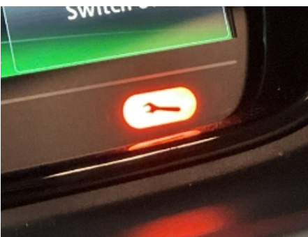
22. Service/ Dokum.