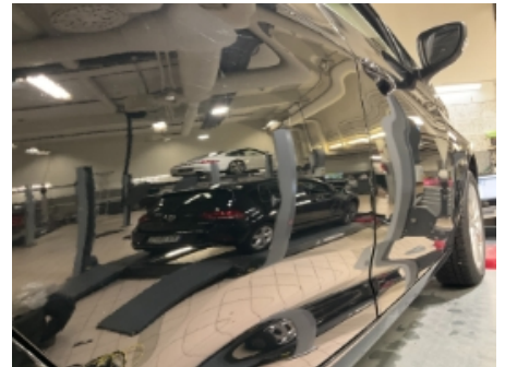
21. Lakk / karosseri utvendig