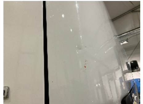
3. Lakk / karosseri utvendig