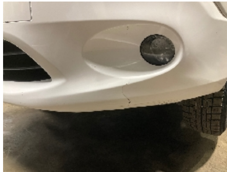
2. Lakk / karosseri utvendig