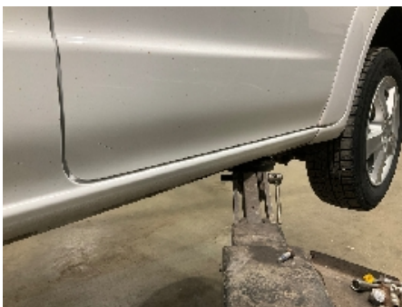
4. Lakk / karosseri utvendig