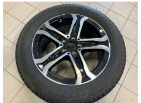
33. Ekstra hjulsett