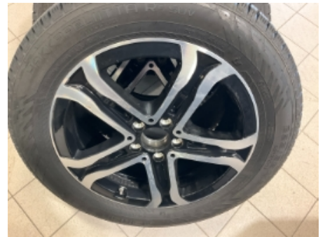
30. Ekstra hjulsett