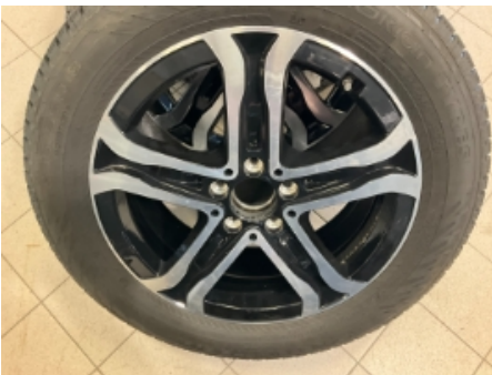
31. Ekstra hjulsett