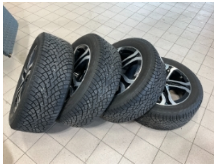
29. Ekstra hjulsett