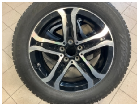
32. Ekstra hjulsett