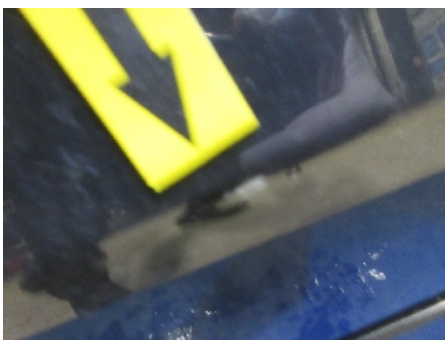
22. Lakk / karosseri utvendig