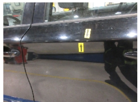
24. Lakk / karosseri utvendig