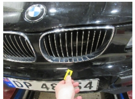
18. Lakk / karosseri utvendig