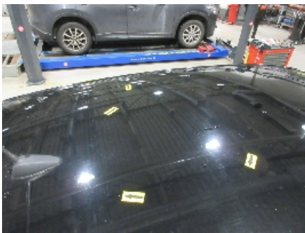
16. Lakk / karosseri utvendig