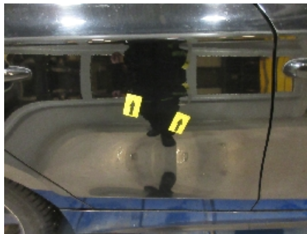
32. Lakk / karosseri utvendig