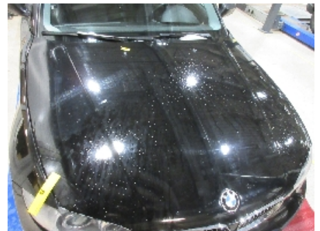
12. Lakk / karosseri utvendig