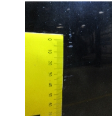
21. Lakk / karosseri utvendig