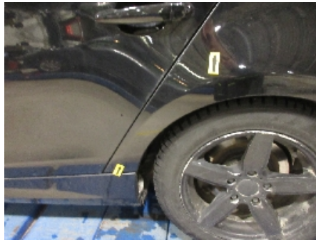
26. Lakk / karosseri utvendig