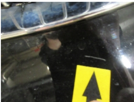
19. Lakk / karosseri utvendig