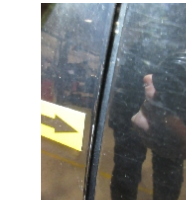
23. Lakk / karosseri utvendig