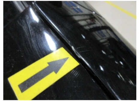
15. Lakk / karosseri utvendig