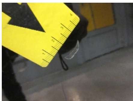
35. Lakk / karosseri utvendig