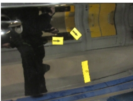
34. Lakk / karosseri utvendig