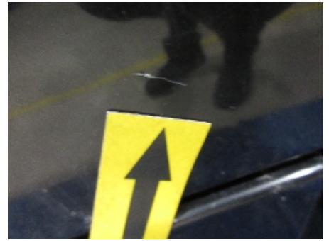
27. Lakk / karosseri utvendig