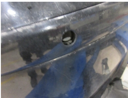
28. Lakk / karosseri utvendig