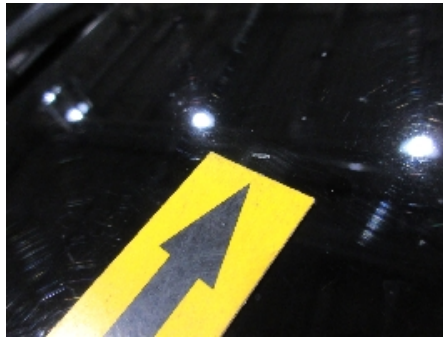
14. Lakk / karosseri utvendig