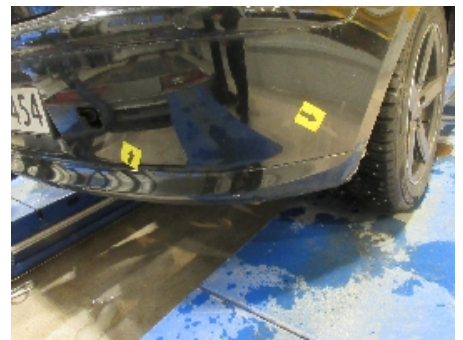
30. Lakk / karosseri utvendig