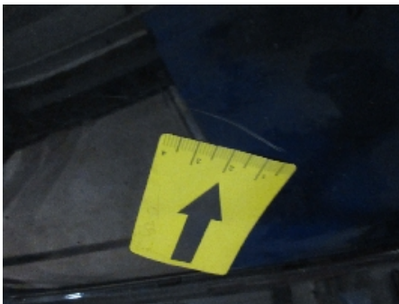
31. Lakk / karosseri utvendig