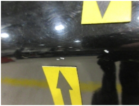
25. Lakk / karosseri utvendig