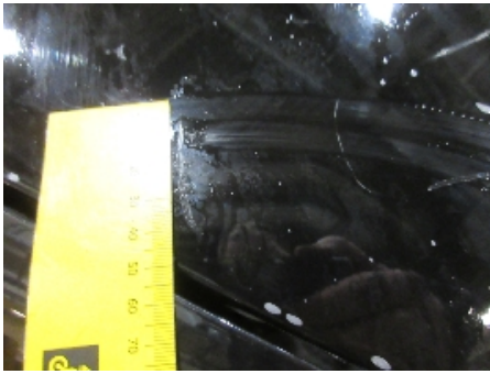
13. Lakk / karosseri utvendig