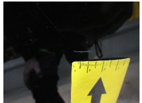
33. Lakk / karosseri utvendig