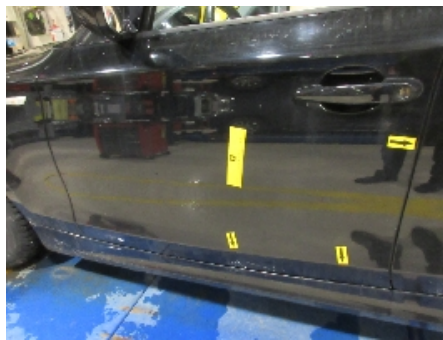
20. Lakk / karosseri utvendig