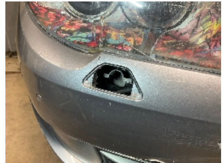
3. Lyktespyler / Visker