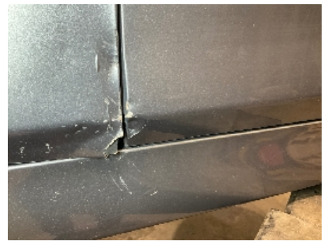
15. Lakk / karosseri utvendig