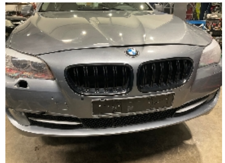
9. Lakk / karosseri utvendig