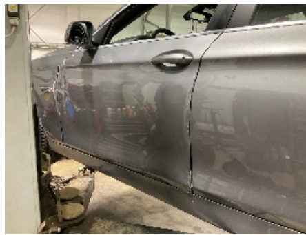
14. Lakk / karosseri utvendig