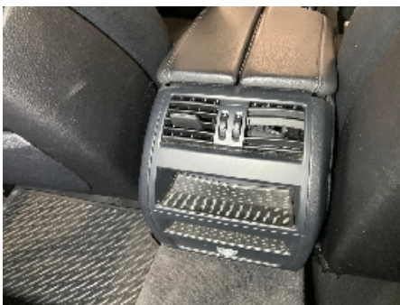
4. Luftdyse kupé