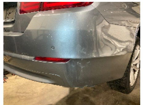
18. Lakk / karosseri utvendig