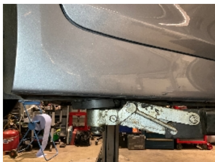
11. Lakk / karosseri utvendig