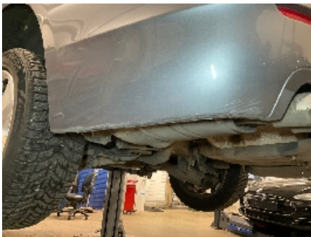
19. Lakk / karosseri utvendig