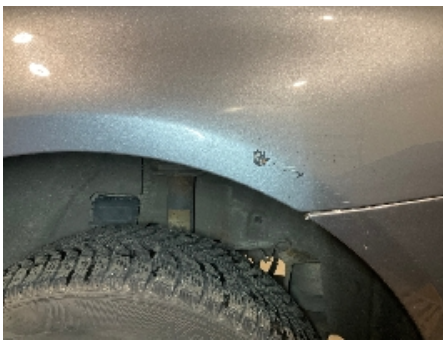
16. Lakk / karosseri utvendig