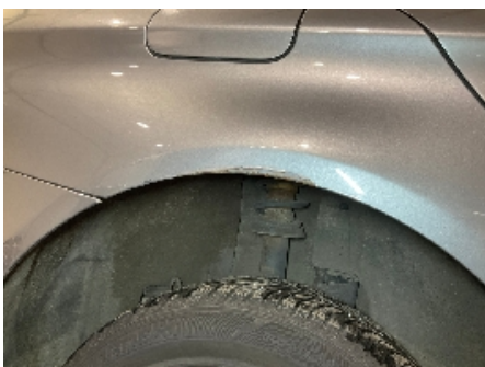
10. Lakk / karosseri utvendig