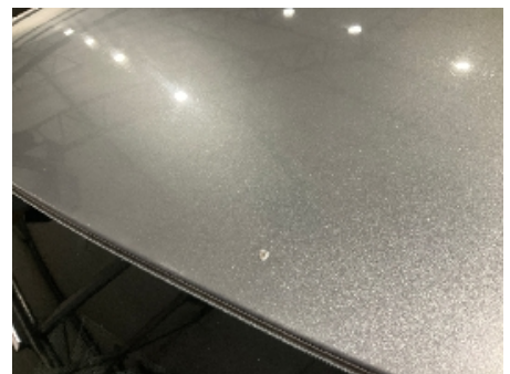
6. Lakk / karosseri utvendig