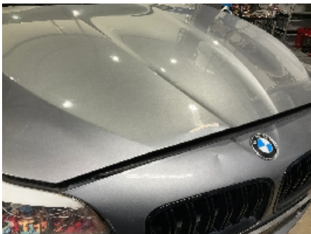
7. Lakk / karosseri utvendig