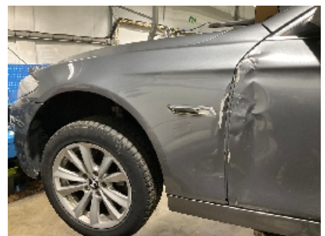
12. Lakk / karosseri utvendig