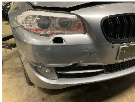
8. Lakk / karosseri utvendig