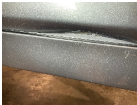
17. Lakk / karosseri utvendig