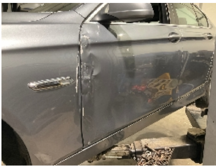
13. Lakk / karosseri utvendig