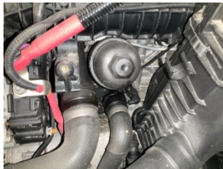
20. Utvendig tilstand motor