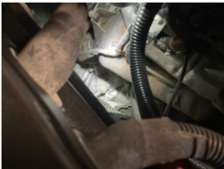
19. Andre feil og mangler