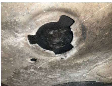
22. Udefinierbare feil