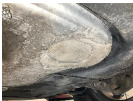
23. Andre feil og mangler