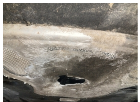
24. Andre feil og mangler