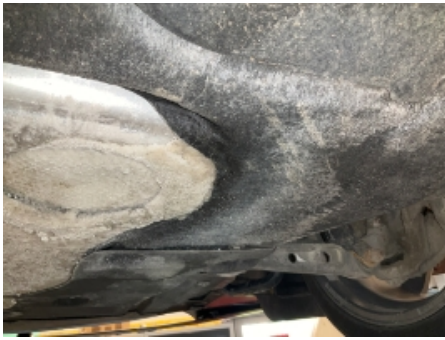
25. Andre feil og mangler