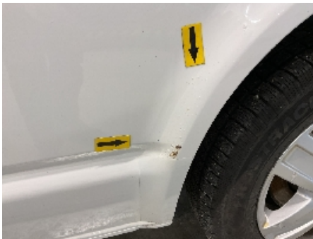
28. Lakk / karosseri utvendig