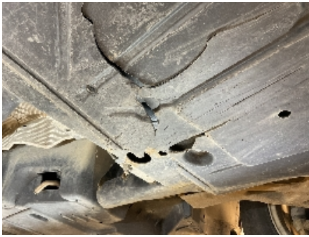
37. Utvendig tilstand motor