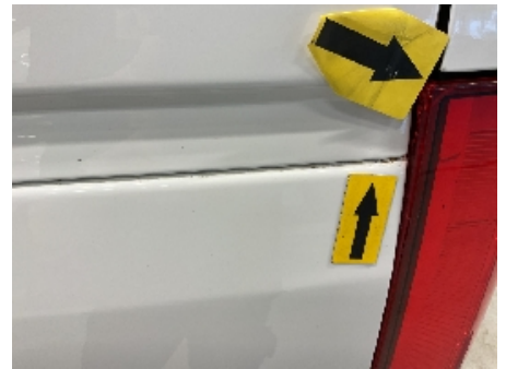
30. Lakk / karosseri utvendig