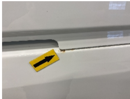
29. Lakk / karosseri utvendig