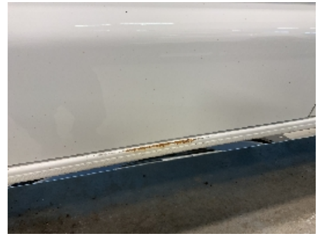
39. Lakk / karosseri utvendig