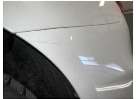
27. Lakk / karosseri utvendig