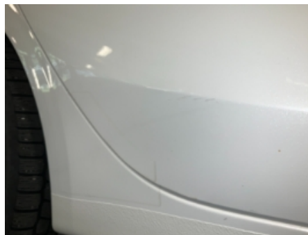
29. Lakk / karosseri utvendig