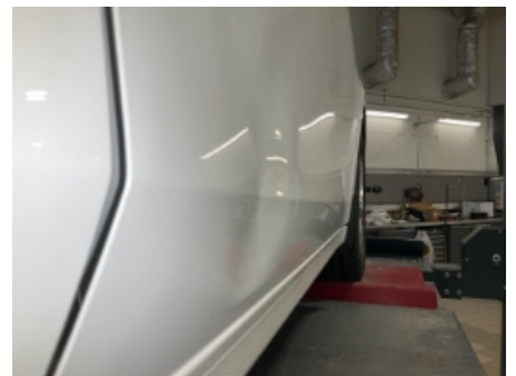
30. Lakk / karosseri utvendig