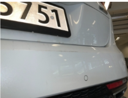
28. Lakk / karosseri utvendig