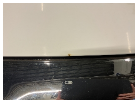
24. Lakk / karosseri utvendig