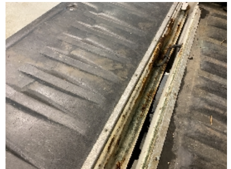
54. Lakk / karosseri utvendig