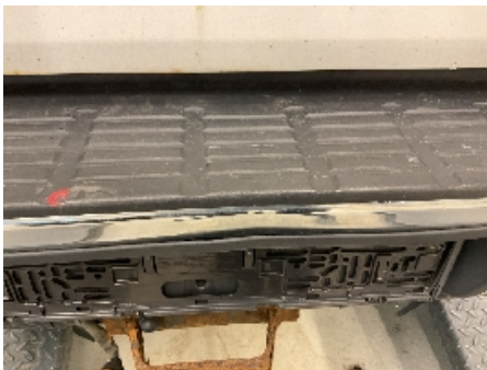
31. Lakk / karosseri utvendig