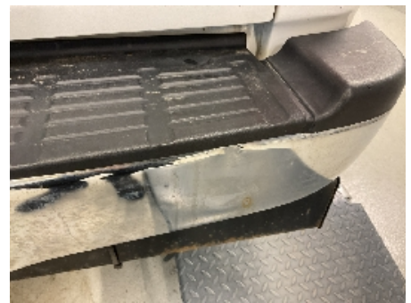
30. Lakk / karosseri utvendig