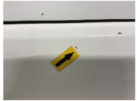
27. Lakk / karosseri utvendig