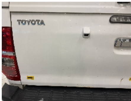
29. Lakk / karosseri utvendig