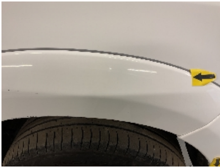
25. Lakk / karosseri utvendig