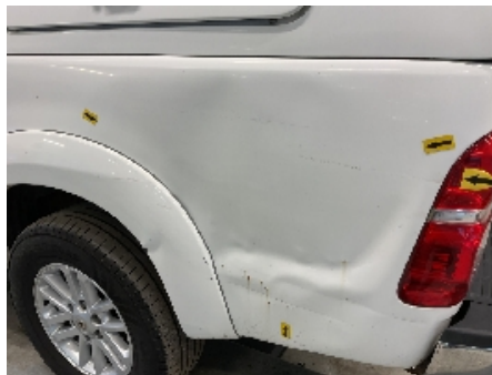
32. Lakk / karosseri utvendig