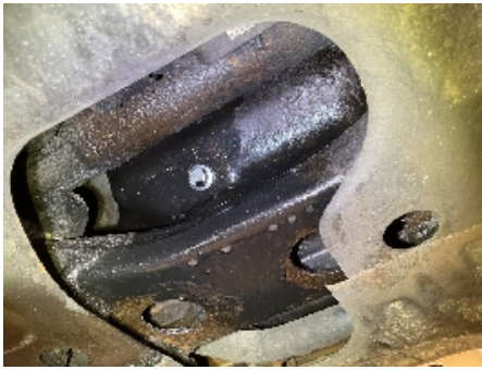
49. Utvendig tilstand motor