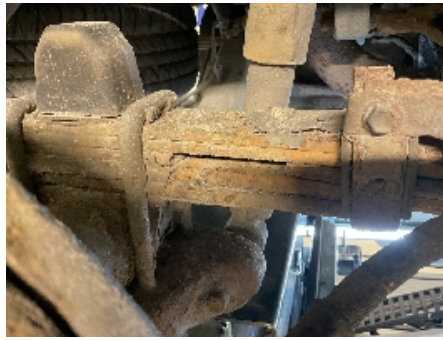
50. Fjærer / fjærbein