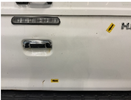
28. Lakk / karosseri utvendig