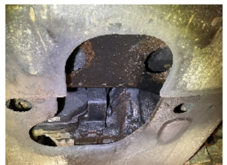
48. Utvendig tilstand motor