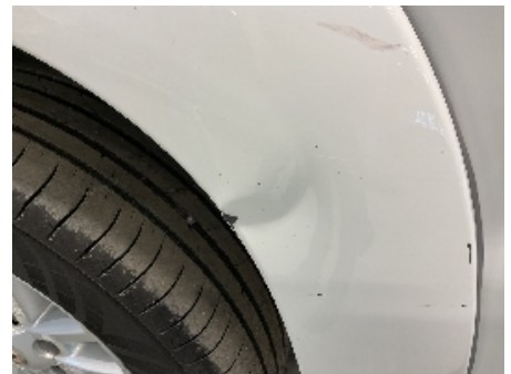
33. Lakk / karosseri utvendig