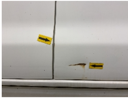
26. Lakk / karosseri utvendig