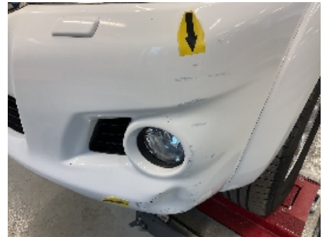
21. Lakk / karosseri utvendig