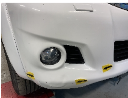
22. Lakk / karosseri utvendig