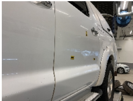
53. Lakk / karosseri utvendig