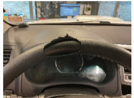
18. Ratt, rattaksel, ledd