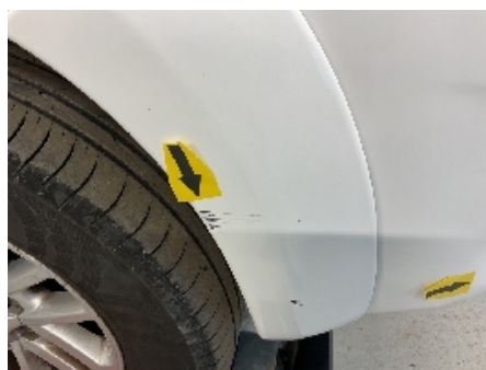
23. Lakk / karosseri utvendig