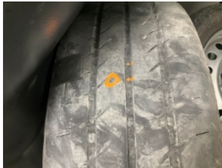
20. Ekstra hjulsett