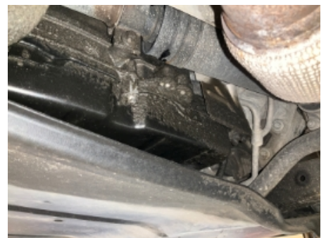
24. Girkasse (automatisk)