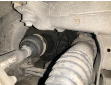
31. Girkasse (automatisk)