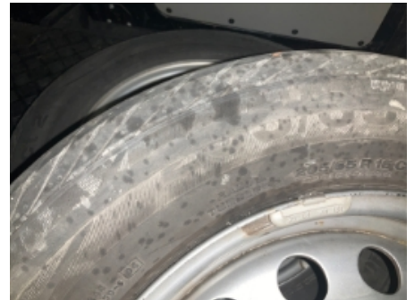
21. Ekstra hjulsett