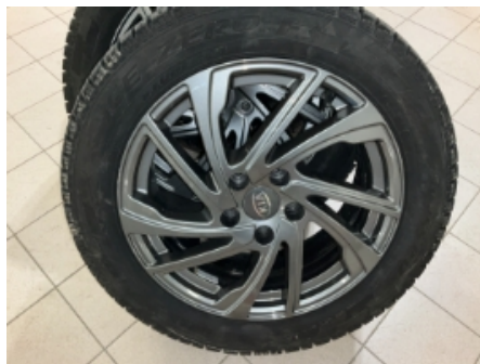
32. Ekstra hjulsett