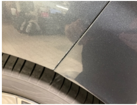
38. Lakk / karosseri utvendig