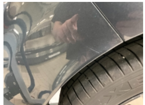
36. Lakk / karosseri utvendig