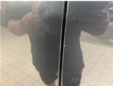
40. Lakk / karosseri utvendig