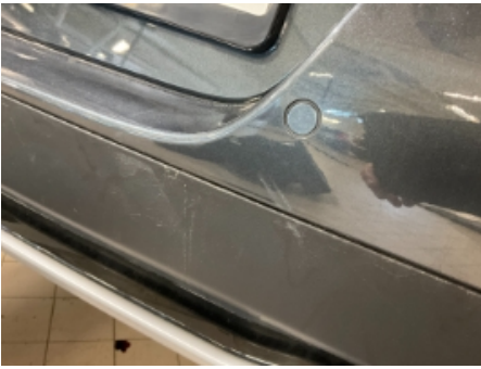
37. Lakk / karosseri utvendig