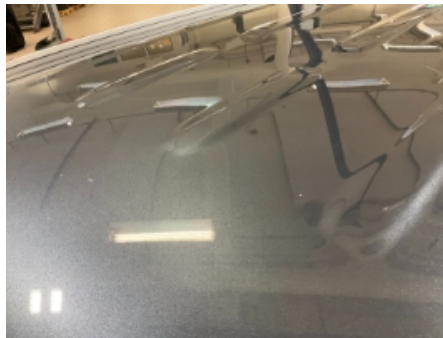
41. Lakk / karosseri utvendig