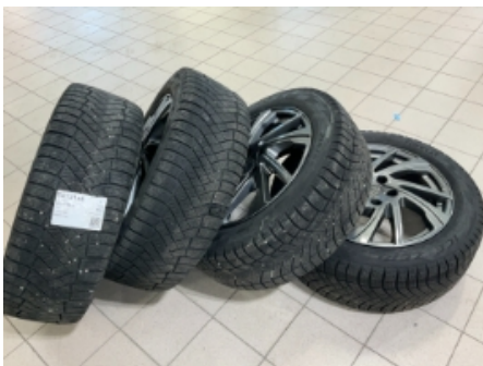
31. Ekstra hjulsett