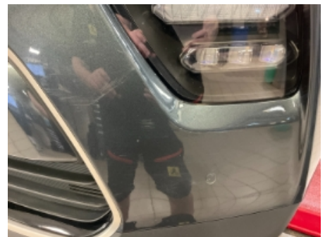
33. Lakk / karosseri utvendig