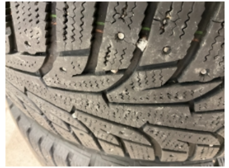
15. Ekstra hjulsett