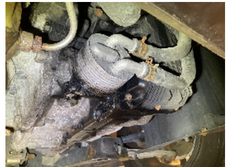
30. Utvendig tilstand motor