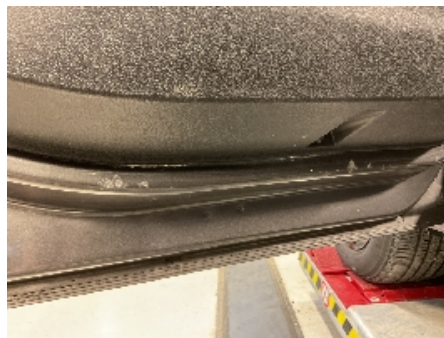
17. Lakk / karosseri utvendig