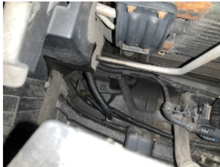
20. Utvendig tilstand motor