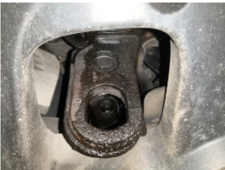
31. Utvendig tilstand motor