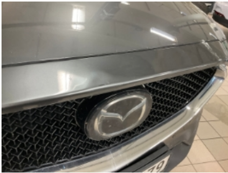
1. Lakk / karosseri utvendig