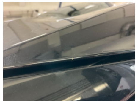
36. Lakk / karosseri utvendig