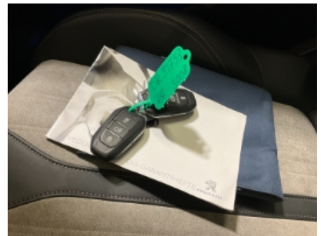
21. Service/ Dokum.