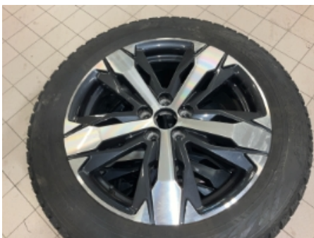
34. Ekstra hjulsett