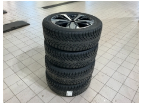
33. Ekstra hjulsett