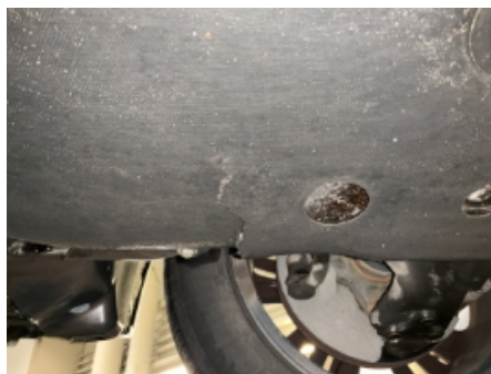
35. Utvendig tilstand motor