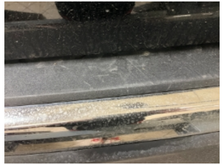
39. Lakk / karosseri utvendig