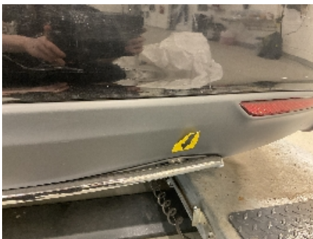
28. Lakk / karosseri utvendig