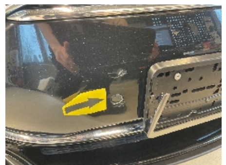
36. Lyd / lyssignaler