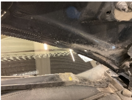
19. Lakk / karosseri utvendig