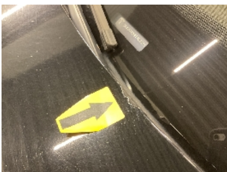
22. Lakk / karosseri utvendig