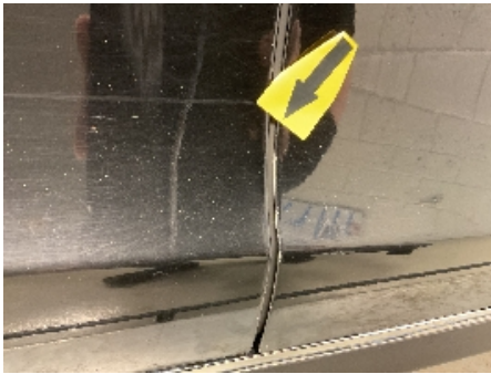
25. Lakk / karosseri utvendig