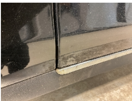
46. Lakk / karosseri utvendig