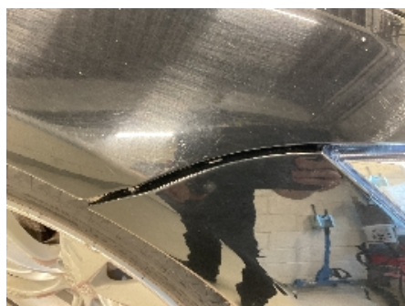
23. Lakk / karosseri utvendig