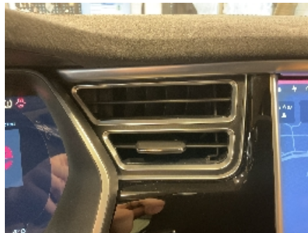
17. Luftdyse kupé