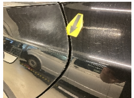
30. Lakk / karosseri utvendig