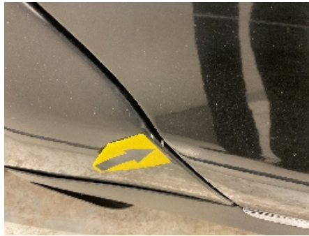
26. Lakk / karosseri utvendig