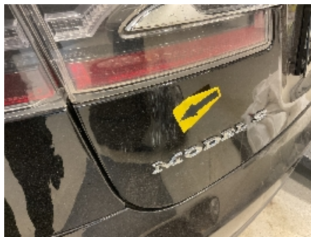
29. Lakk / karosseri utvendig