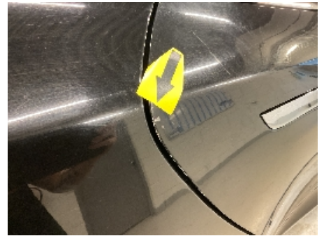
27. Lakk / karosseri utvendig