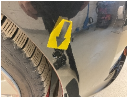
37. Lyd / lyssignaler