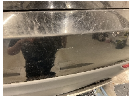
45. Lakk / karosseri utvendig