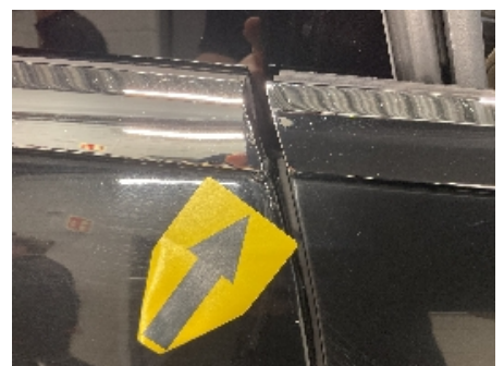
24. Lakk / karosseri utvendig