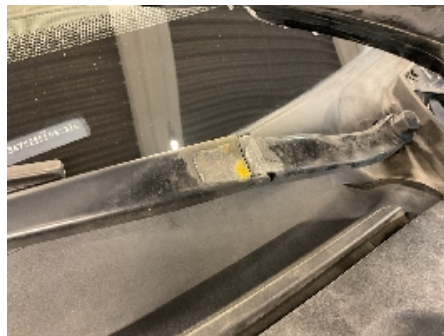
20. Vindusvisker, spyer (foran/bak)