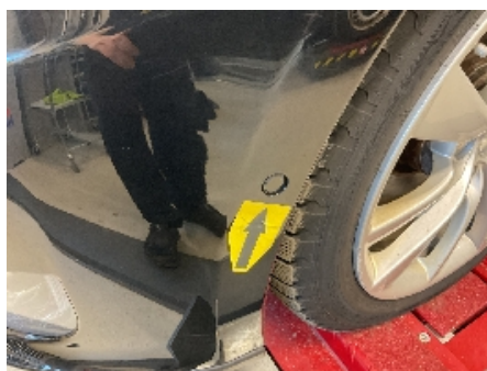
35. Lyd / lyssignaler