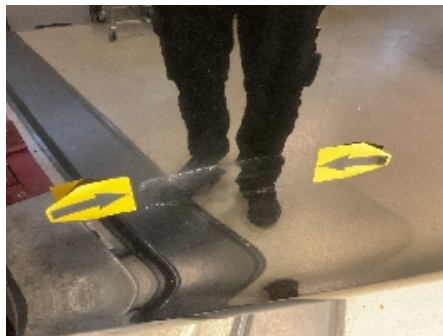
32. Lakk / karosseri utvendig