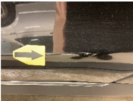
31. Lakk / karosseri utvendig