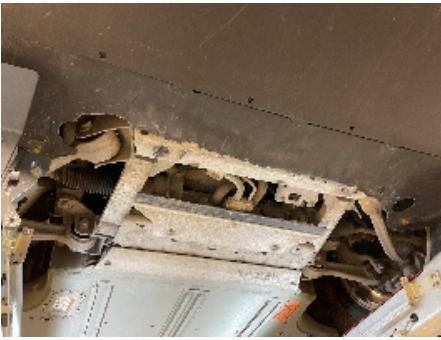
49. Utvendig tilstand motor