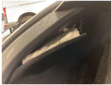
38. Interiør generelt