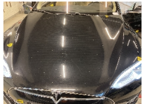
21. Lakk / karosseri utvendig