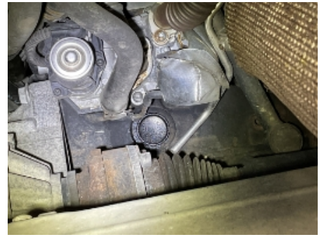
39. Utvendig tilstand motor