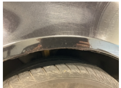
30. Lakk / karosseri utvendig