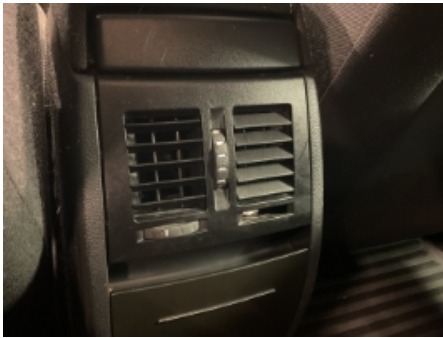
13. Luftdyse kupé