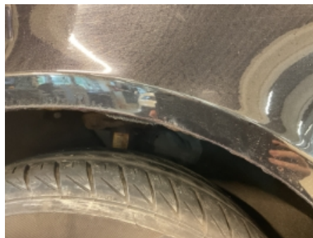
29. Lakk / karosseri utvendig