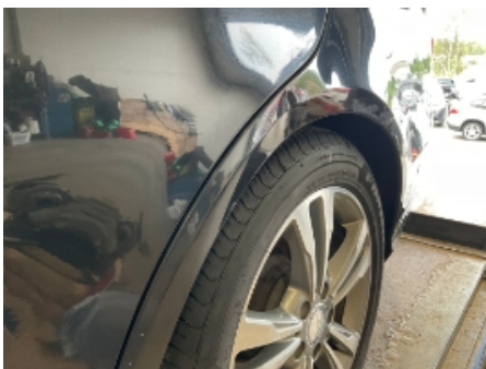
4. Lakk / karosseri utvendig