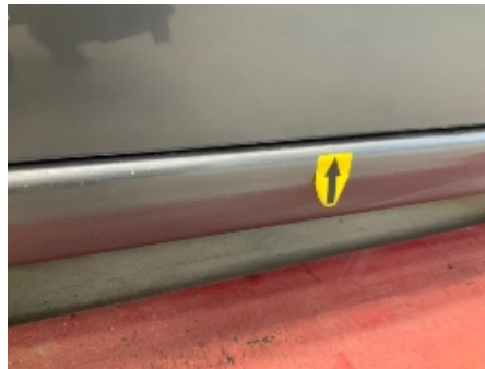
29. Høyre kanal