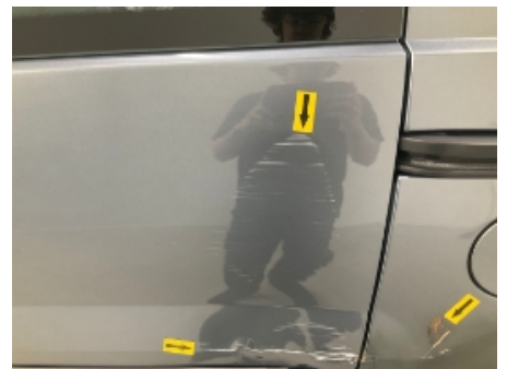
18. Venstre bakdør