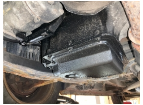
51. Utvendig tilstand motor