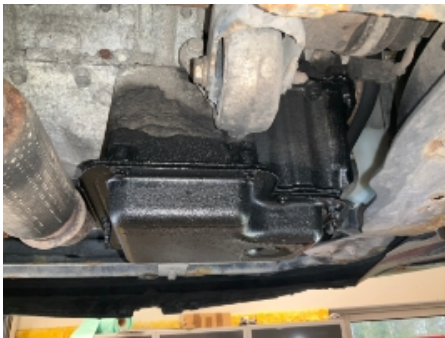
52. Utvendig tilstand motor