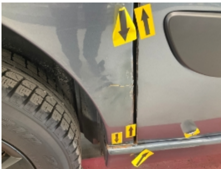
31. Høyre bakskjerm