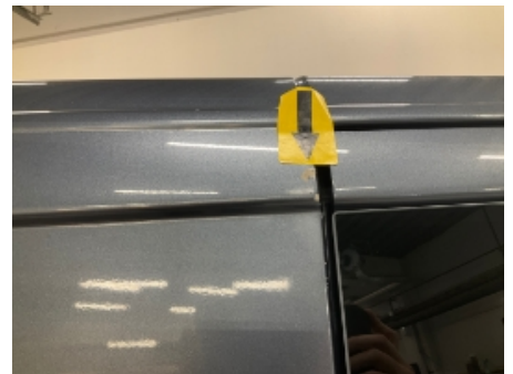
33. Høyre bakskjerm