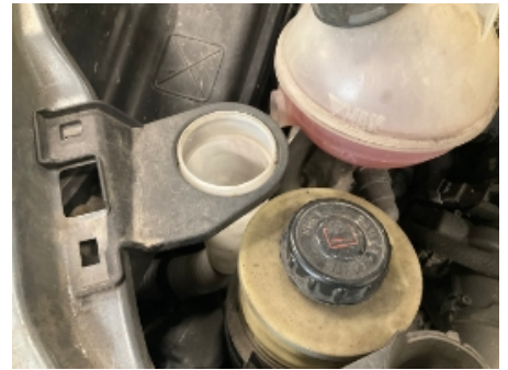
39. Vindusvisker, spyer (foran/bak)