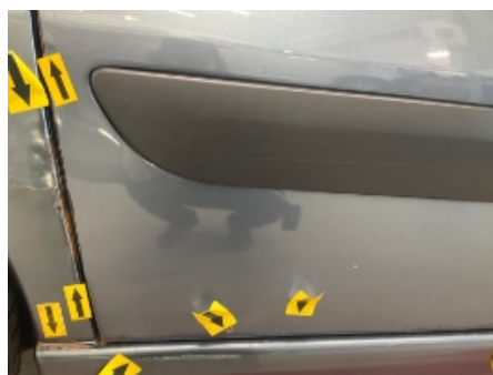
35. Høyre bakdør