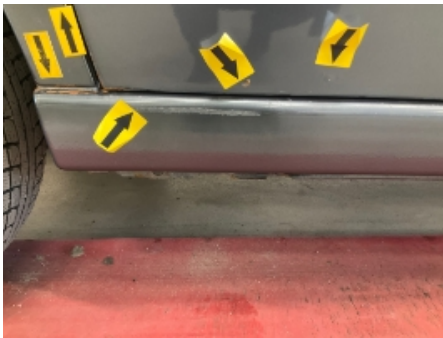
28. Høyre kanal