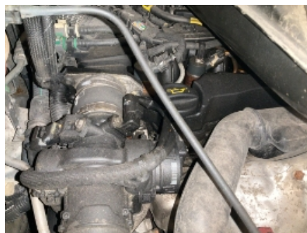
44. Utvendig tilstand motor