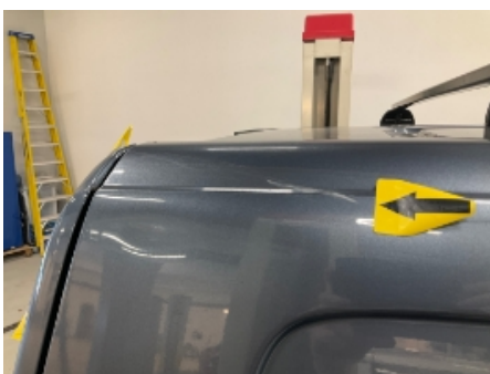
34. Høyre bakskjerm