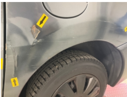
19. Venstre bakskjerm