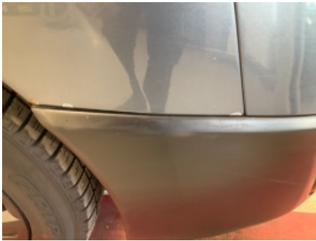
37. Høyre forskjerm