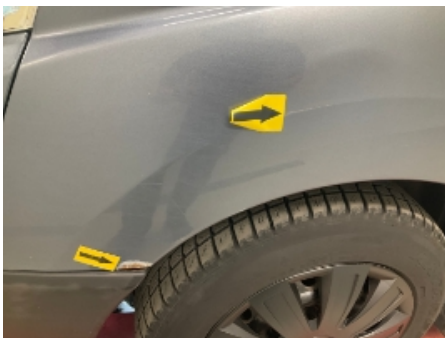
16. Venstre forskjerm