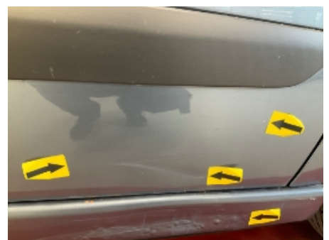
36. Høyre fordør