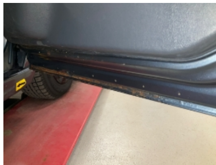
41. Høyre fordør