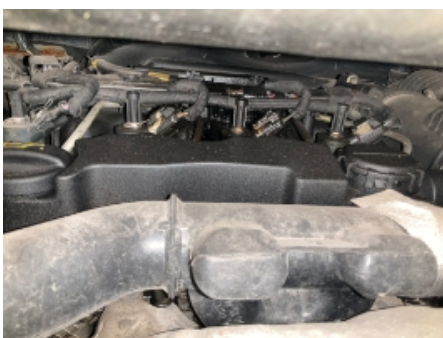
46. Utvendig tilstand motor