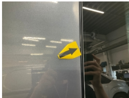
32. Høyre bakskjerm