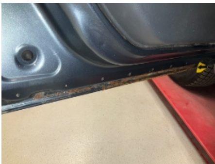
40. Venstre fordør