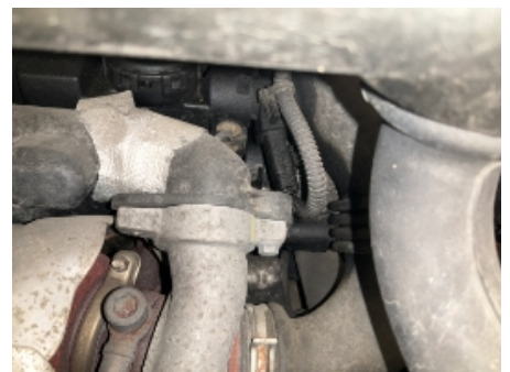
45. Utvendig tilstand motor