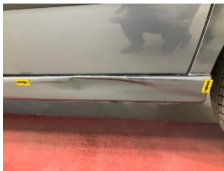
20. Venstre kanal