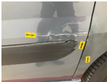
17. Venstre bakdør