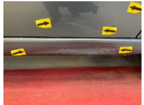
30. Høyre kanal