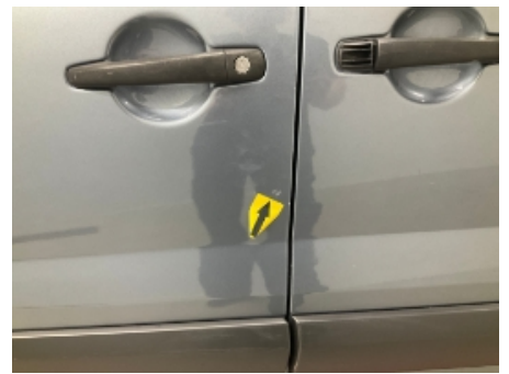
15. Venstre fordør