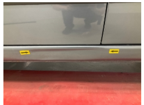
21. Venstre kanal