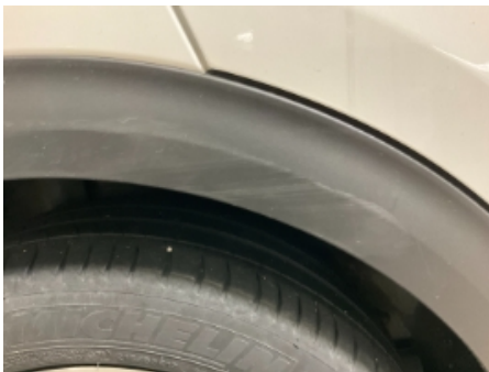
31. Lakk / karosseri utvendig