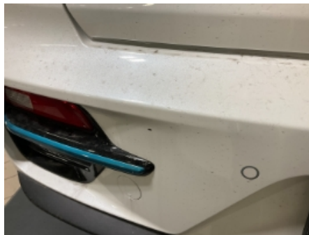
32. Lakk / karosseri utvendig