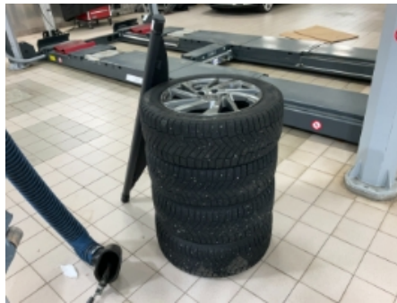
29. Ekstra hjulsett