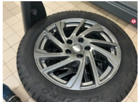
30. Ekstra hjulsett